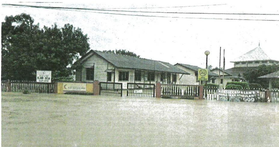
The flood at the Alor Lintah rural clinic in Besut yesterday.

She said the department had taken measures to prevent the spread of infectious diseases and had conducted vector control at