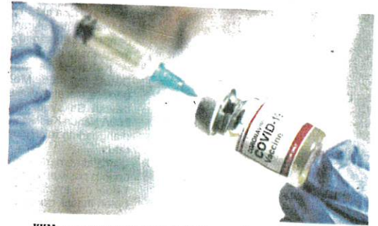
KKM menggesa agar semua individu yang layak, tampil untuk mendapatkan vaksin dos penggalak.

Menurutnya, KKM akan memantau dengan rapi penularan jangkitan itu dalam masyarakat menerusi pelaksanaan aktiviti