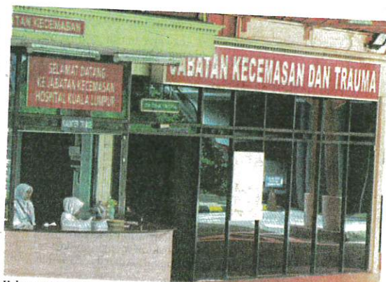
Kekurangan doktor perlu diatasi bagi mengelak isu berlanjutan. (Foto hiasan)

"Jika tidak, memang kajilah sampai Abang Jamil LO (sehingga tiada kesudahan)," katanya.