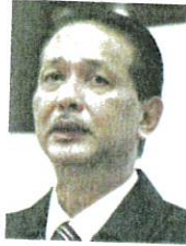
DR NOOR HISHAM

memastikan semua Pusat Penilaian Covid-19 (CAC) bersedia menerima kedatangan pesakit yang tinggi untuk membuat penilaian terhadap pesakit positif dengan fungsi pengoperasian CAC meliputi mengenal pasti pesakit memenuhi kriteria untuk dipantau di rumah