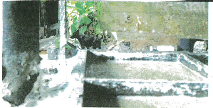
SALAH sebuah premis membuat makanan yang kotor dan diarahkan tutup. – GAMBAR HIASAN

AKHBAR : KOSMO MUKA SURAT : 6 RUANGAN : NEGARA