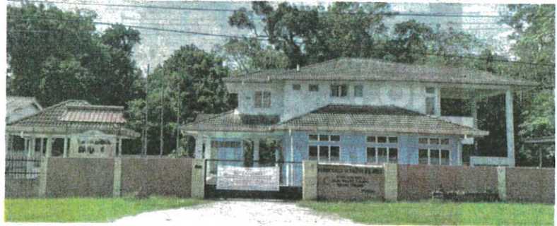
Perkhidmatan Klinik Desa Batu 8, Kampar dipindahkan ke Klinik Kesihatan Tanjung Tualang.

IPOH - Klinik Desa Batu 8, Tanjung Tualang, Kampar yang beroperasi sejak 25 tahun lalu akan melabuhkan tirainya secara rasmi mulai Januari 2023 disebabkan jumlah kehadiran pesakit yang rendah.