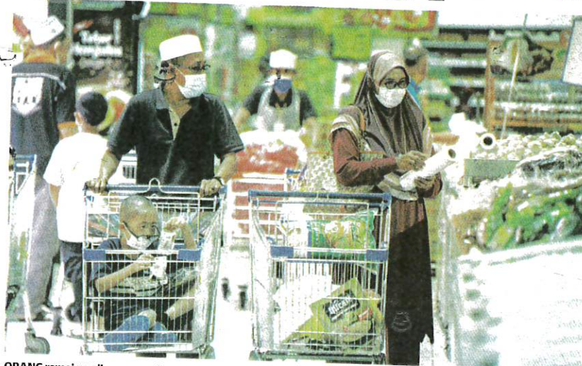
ORANG ramai masih mengenakan pelitup muka ketika berada di tempat awam serta luar rumah walaupun sudah tidak diwajibkan lagi. - GAMBAR HIASAN

"Bagi langkah ketiga, semua Pusat Penilaian Covid-19 (CAC) yang beroperasi secara fizikal akan bersedia menerima kedatangan atau panggilan pesakit yang tinggi untuk membuat pe-