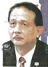
Tan Sri Dr Noor Hisham Abdullah

He said CACs would start prescribing high-risk Covid-19 patients with the Paxlovid (nirma-