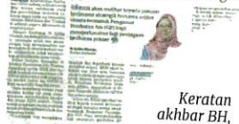
Keratan akhbar BH, semalam.